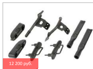
Площадка центрального кофра 08L70-MKA-D80